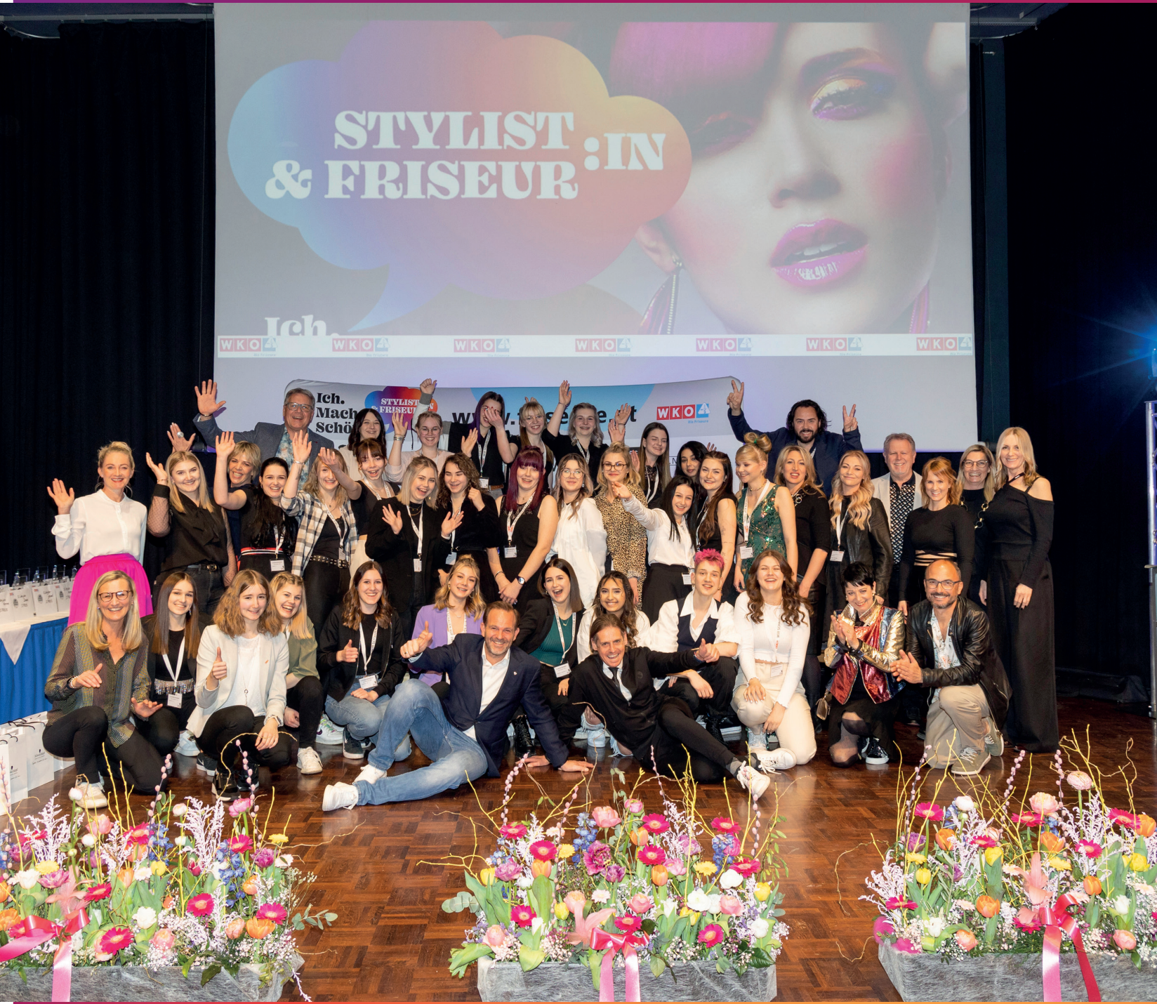
Alle Teilnehmer:innen des TyrolSkills Landeslehrlingswettbewerbs 2023.

Mit Unterstützung der Partner der Industriekooperation